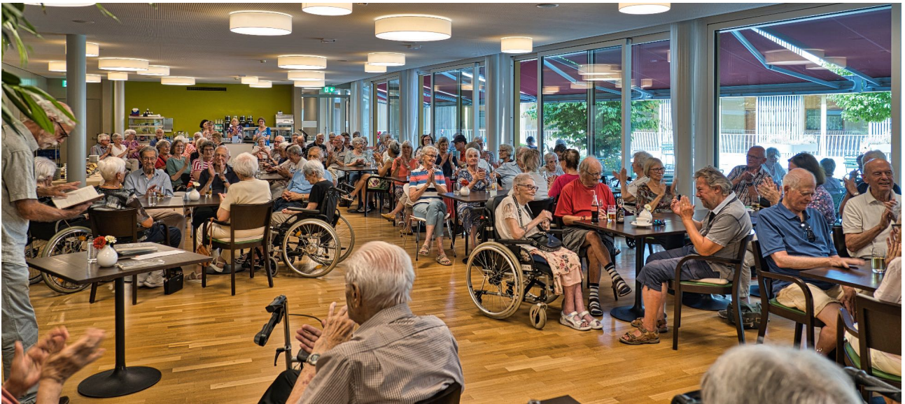
Am Sommercafé 2024 feierte der Seniorenverein sein 10jähriges erfolgreiches Wirken. Viele Mitglieder feierten mit